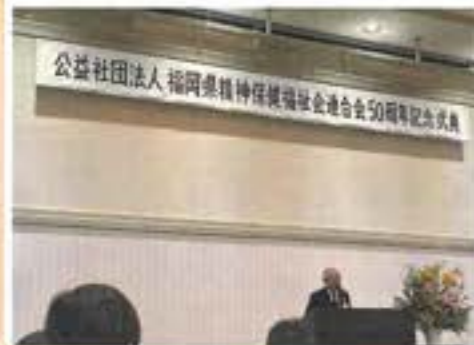
公益社団法人福岡県精神保健福祉会創立50周年記念式典

最後に「50年の歩み」を動画で振り返りました。「ご多忙の中、多くの来賓の皆様、会員の皆様にご出席いただき、50年の節目をお祝いできました。事を誠に感謝申し上げます。今後とも何卒宜しくお願い致します。」