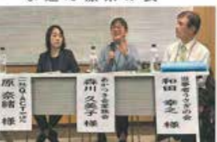
本大会開催にあたり、協賛・寄付を賜りました皆様、御礼申し上げます。また、講師の方からもご寄付いただき、心よりお礼申し上げます。

共感しました。感動しました。待ち望んでいたお話でした。 ◎施設、病院から地域へ、本人を主体に、バタナリズムを排して、いくなこと。支援する立場として、みんなちがってみんないい、対応に苦しむことも多いですが、ひるまない、あきらめない、希望を引き出す支援の大切さ。 ◎医療や福祉を経済優先で捉えることの怖さを知った。 ◎家族会、当事者の方のお話は共感できました。医療機関をはじめ、包括的支援が進められるのを期待します。 ◎家族はどうすれば良いかを参考に、毎日の生活を考えていこうと思えます。 ◎今まで支援の在り方を振り返って反省する点に気づいた。 ◎ACTが地元であればいいなと思えました。活動に力をつけていきたいです。